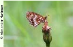
Der Natur auf der Spur.