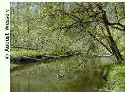
Vom Wasser geprägte Artenvielfalt.