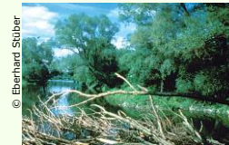
© Eberhard Stuber Der Nationalpark Donau-Auen ist wald- und wasserreich.