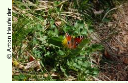
© Anton Heufleder Im Alpenpark Natur beobachten und kennen lernen.