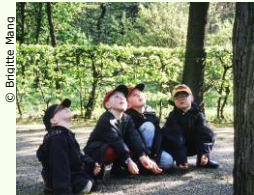
© Britta Mang Biodiversitat & Stadtokologie.