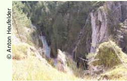
© Anton Heufleder Mit Experten die Klamm erkundern und erfahren.