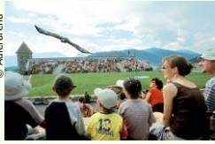
Flugschau mit dem Steinadler.