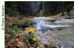
© Franz Kovacs Private Forschungsexkursion im Nationalpark Kalkalpen.