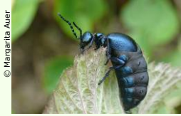
Der NATURSCHUTZBUND Wien zeigt Vielfalt im Naturgarten.