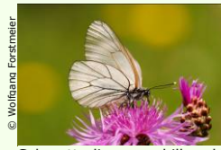
Schmetterlinge – schillernde Insekten.