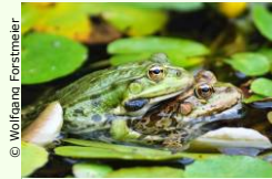
Schutzmaßnahmen für Amphibien in Salzburg.