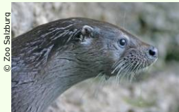
Heimische Artenvielfalt im Salzburger Zoo erleben.