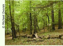
Totholzreiche Wälder fördern die Artenvielfalt.