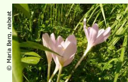
© Maria Bern, nabeeat Vortrag im Linzer Biologiezentrum.