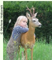
Die Arten des Waldes in der Werkstatt-Natur.